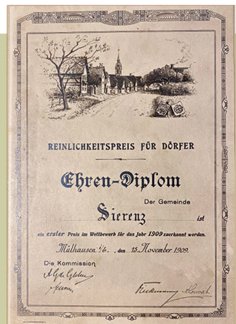
Document prêté par Pierre ENDERLIN.

Merci aux membres du service technique de la Ville, et à tous les Sierentzoises et Sierentzois qui œuvrent au quotidien en entretenant leurs maisons, jardins, trottoirs... et contribuent ainsi à valoriser notre beau cadre de vie !