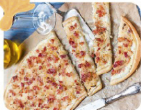
Tarte Flambée 6€ et gratinée 7€

Le Sierentz Tir Sportif vous convie à sa 1 re soirée d'automne, le samedi 16 octobre 2021 à partir de 18h00