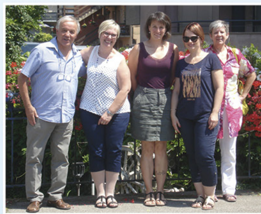
Le jury 2018