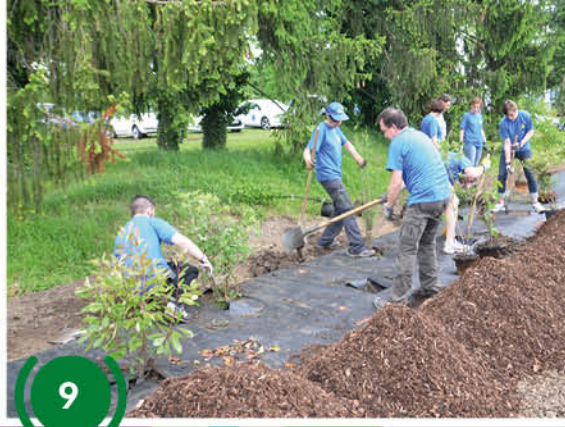
Plantation d'une haie vive le long du cimetière (9/10)