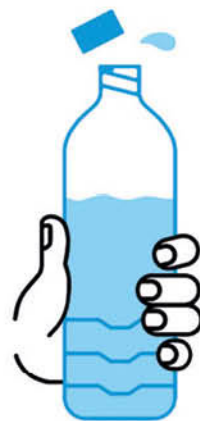
JE BOIS RÉGULIÈREMENT DE L'EAU

En période de canicule, quels sont les bons gestes?