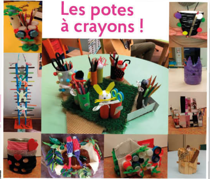
Les pots à crayons !

Félicitations à tous les enfants et plus particulièrement à Elsa, Jana et Amélie dont le pot (photo au centre) a été le plus apprécié des parents.