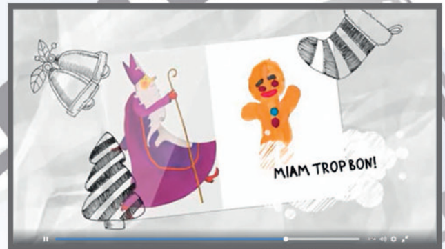
Marché de la Saint-Nicolas