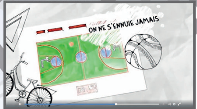
Plein d'activités à Sierentz