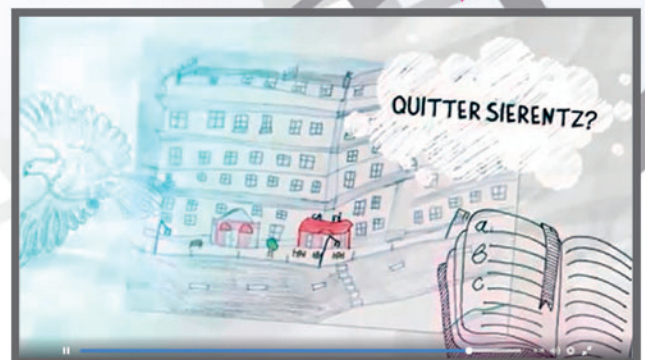
Quitter Sierentz ?