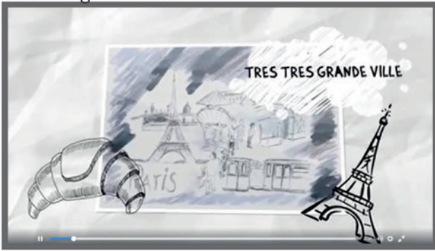
Une très grande ville