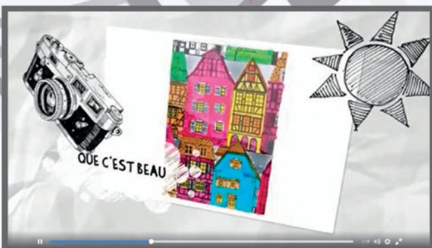
C'est beau l'Alsace