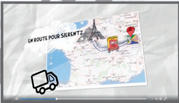
En route pour Sierentz