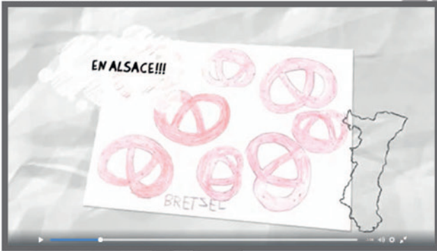
Mutée en Alsace