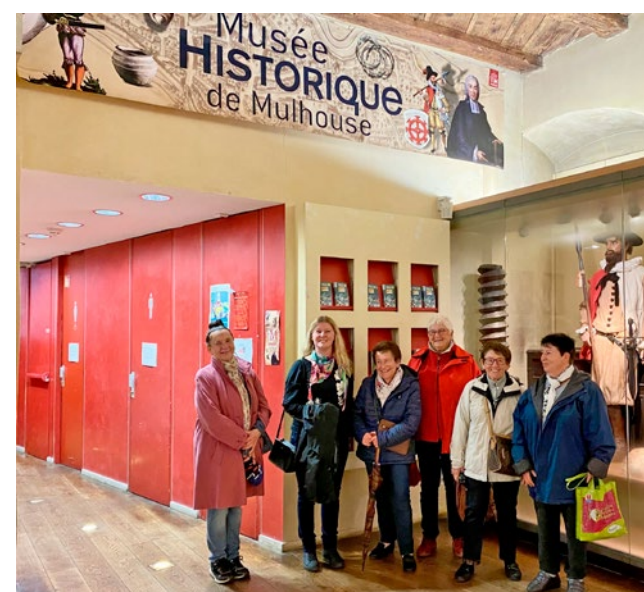
Sortie à Mulhouse