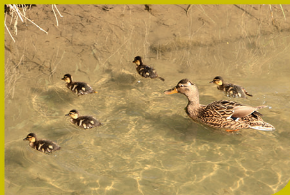
Photo prise derrière la rue du Maréchal Foch.

La LPO (Ligue pour la Protection des Oiseaux) déconseille de donner du pain aux canards, et aux oiseaux en général, car « il remplit l'estomac des oiseaux sans leur apporter les nutriments dont ils ont besoin et leur provoque de grosses carences alimentaires ».