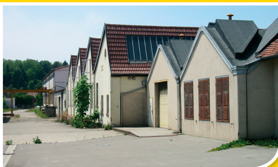
Ancien site ADECO en 2004

La Commune avait souhaité néanmoins pouvoir contrôler son développement, réalisant dans la foulée de l'acquisition des terrains une opération d'aménagement concerté (ZAC).