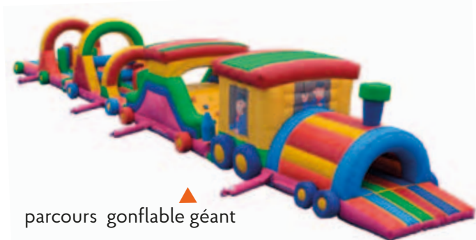
parcours gonflable géant