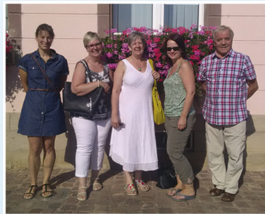
Le jury 2019